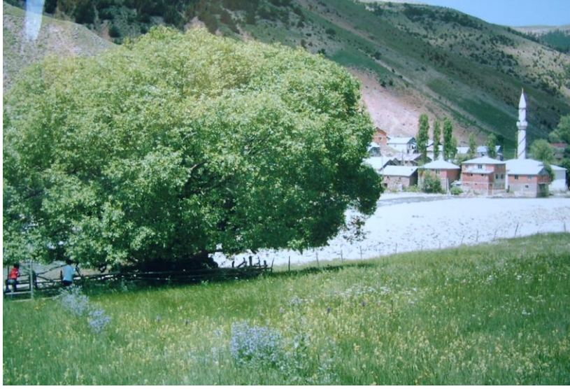
Kasım Dede'nin Mezarı Üzerindeki Kutsal Söğüt Ağacı (Zeyret)

Sonraki yüzyıllarda aslî fonksiyonunu yitirmiş ve giderek feodalleşmiş olan bu kolonizatör Türk zaviyesinin, XVI. yüzyıldan sonraki durumunu ortaya koyacak, özgün bilgiler ihtiva eden arşiv kayıtlarına veya başka materyallere henüz ulaşabilmiş değiliz. Bunu elde ettiğimiz gün, bahse konu kurumun sosyolojik dönüşümünü de izleme fırsatını yakalamış olacağız.