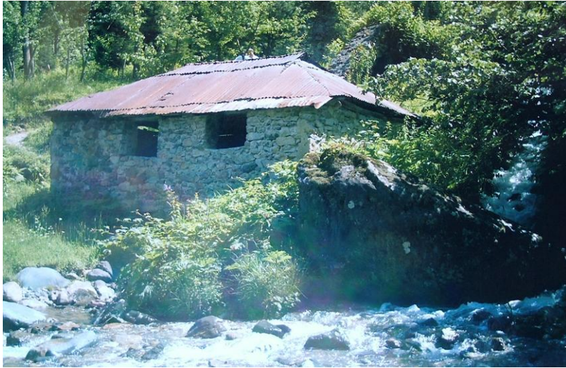
Kasım Dede Değirmeni