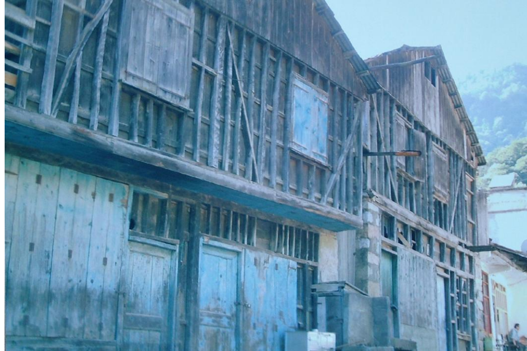
Y. Boynuyoğun (Tekke) Köyünün Merkezindeki Tarihi Hanlar (Derbent Kalıntısı)